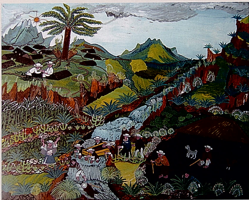
Camino del cementerio con el río crecido. Alberto Toaquiza, 1987. Esmalte sobre cuero de oveja. Colección Paco Valiñas

La intervención de Olga Fisch ha sido considerada por muchos la responsable exclusiva del florecimiento del arte de Tigua 5 . La pintora húngara había llegado al