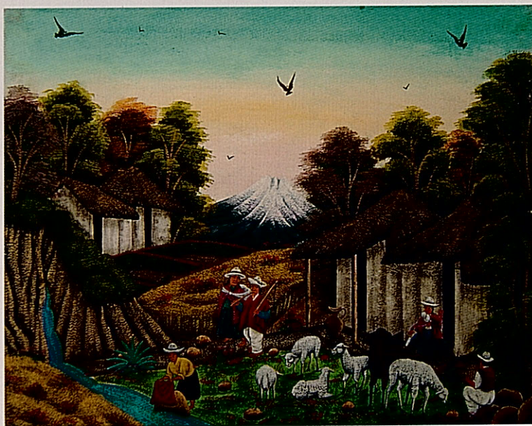
Paisaje de Tigua. Gustavo Quindigalle, 2007. Óleo sobre cuero de oveja. Colección Paco Valiñas.

El arte de Tigua es una rica expresión del momento presente, un movimiento al mismo tiempo primitivo y actual, aborígen y, a la vez, producto de la cultura visual de nuestra época. Es una forma de expresión y una vía de desarrollo, una actividad creativa que, como todas las demás, fluctúa entre el neto impulso estético y la tácita exigencia del mercado. Con él, todo un pueblo se reafirma y legitima, dando a conocer al mundo su verdad y su historia, su clamor