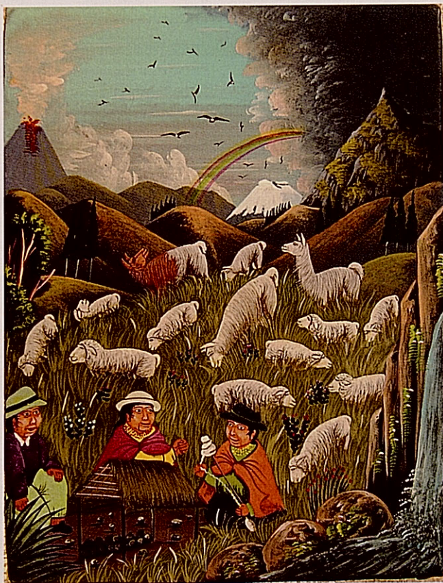
Niños pastores al pie de la Mama Tungurahua. Fabián Tigasi, 2007. Acrílico sobre cuero de vaca. Colección Paco Valiñas.

los gemelos Illinizes. La bendición de la Pachamama se hace presente en la representación de montes con caras humanas que, a menudo, escupen ríos de agua clara, flujo nutricio que reverdece los campos con su humor vital.