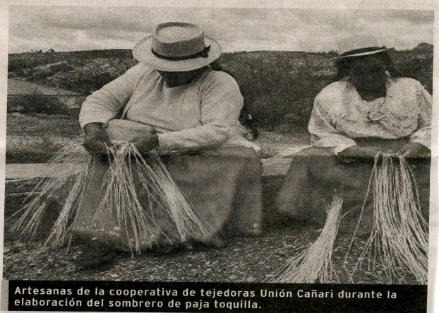
Artesanas de la cooperativa de tejedoras Unión Cañari durante la elaboración del sombrero de paja toquilla.