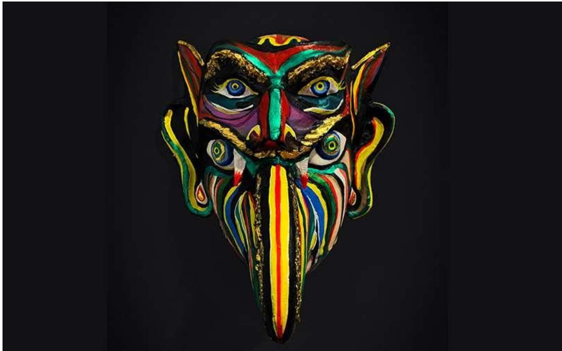
"Máscara de diablo", Vicente Flores, Cuenca, 2022.

El Cidap, en Cuenca, mantiene una estupenda colección de artesanías, promueve el arte popular y participa en muestras que a veces incluyen Europa.