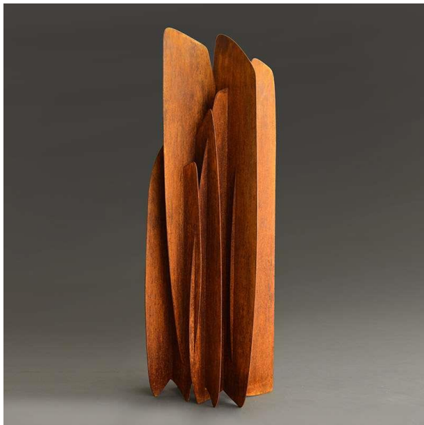
“Infiernillos”, Andrés Aguirre, escultura en metal.