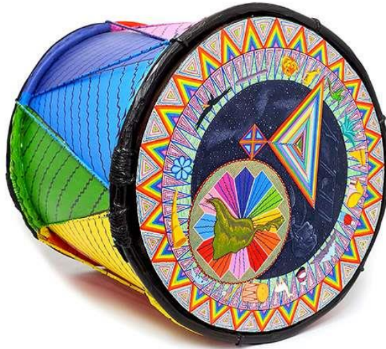
“Tambor”, autor anónimo, Cotopaxi.

Recuperar aquello que se escapaba de las manos, documentar las manifestaciones populares que se perdían en las nuevas generaciones, incorporar el conocimiento y la práctica del diseño moderno, fueron algunas de las acciones que se empezaron a manifestar en los primeros centros y museos de artes populares y artesanías que aparecieron entre 1960 y 1970 en toda América Latina.