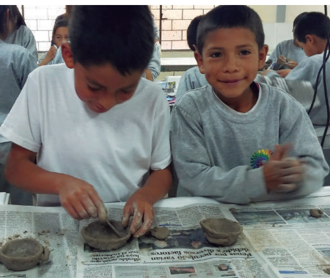
Figura 4: Visita a la Escuela Fasayñan, Chordeleg, 2017

En el año 2014, surge el “Primer Ciclo Internacional de Cine sobre Artesanías y Cultura Popular” , evento de exhibición cinematográfica cuyo objetivo principal fue crear un espacio de acercamiento de la ciudadanía a las manifestaciones artesanales y culturales de los pueblos americanos. Cada año, a manera de preámbulo del Festival de Artesanías de América, se realiza la presentación de cortometrajes y largometrajes de diversos países, testimonios, historias y experiencias de artesanos que a través de video documental resguardan la memoria cultural y la identidad de los pueblos.