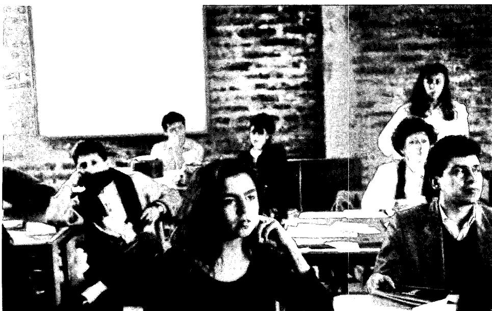
Un grupo de estudiantes atiende una clase teórica en las instalaciones de Canelo de Nos.

Chile con su loca geografía, con su poder cultural atestiguado en el mundo por dos Premios Nobel de Literatura, con sus huasos y sus rotos, con sabor a empanada y vino tinto, con la espontánea hospitalidad de sus gentes será testigo de este esfuerzo integracionista de la cultura popular que aquí, en el Canelo de Nos lo estamos ya realizando a ritmo de cueca. ■