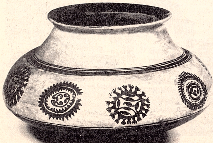
Vasija de arcilla modelada y pintada a mano. Se la impermeabiliza y abrillanta con copal caliente. Arte de la comarca amazónica del Ecuador.

(Los anteriores conceptos fueron expresados hace más de tres años por un distinguido cuencaño. Resultan un vaticinio válido para la actividad del CIDAP).