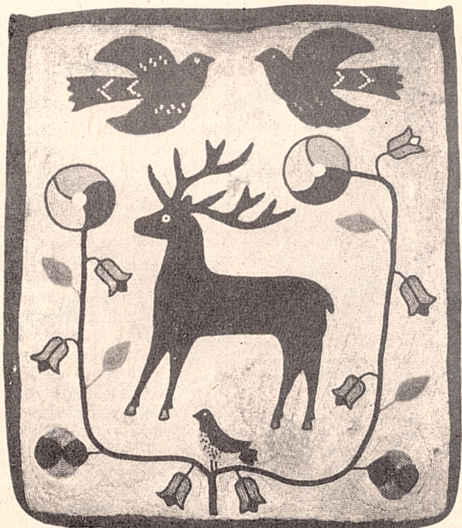
Bolso con trabajo policromado de "chaquira" Arte de los pueblos del norte de los Estados Unidos.

Por encima de toda cuestión relativa a lo nuevo y lo viejo en la cultura, la mano del hombre, es el eterno instrumento, es la eterna herramienta dotada de sensibilidad, que interpreta plásticamente las ideas y los impulsos creativos del ser humano.